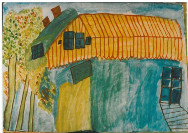
Ilustracja 3. Dom, plakatówka, karton /wł. H.Welcz/